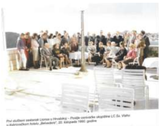
Prvi službeni sastanak Lionisa u Hrvatskoj – Povijesno-cerimonijska skupština LC Sv. Vlaho u dubrovačkom hotelu „Belvedere“, 20. listopada 1990. godine